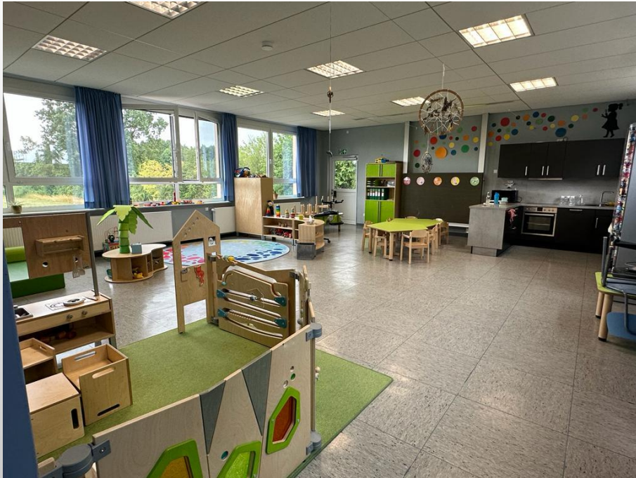
Gruppenraum mit verschiedenen Spielecken