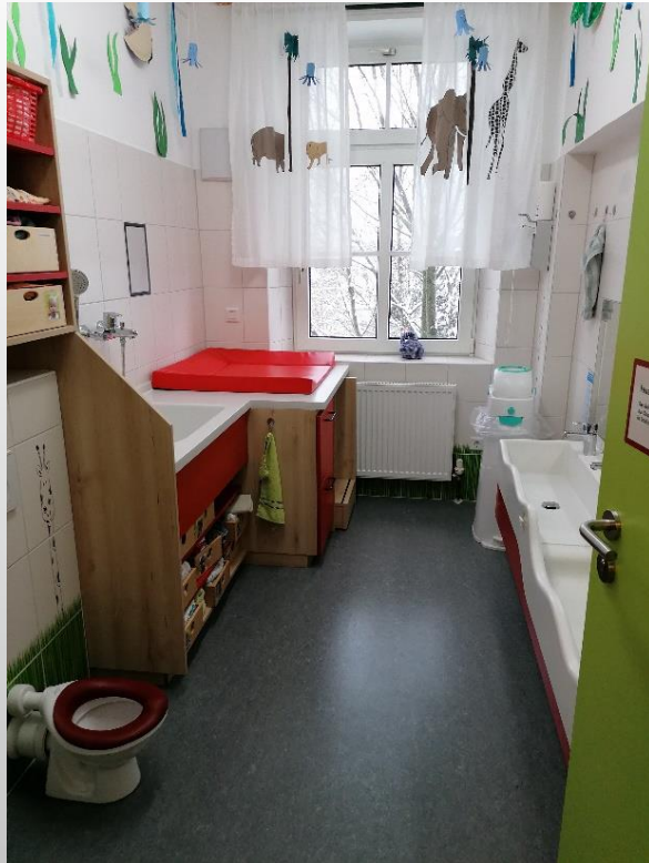
Waschraum der Krippengruppe