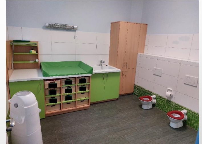
Waschraum der Krippengruppe Jede Gruppe verfügt über einen eigenen Waschbereich in seiner Etage.