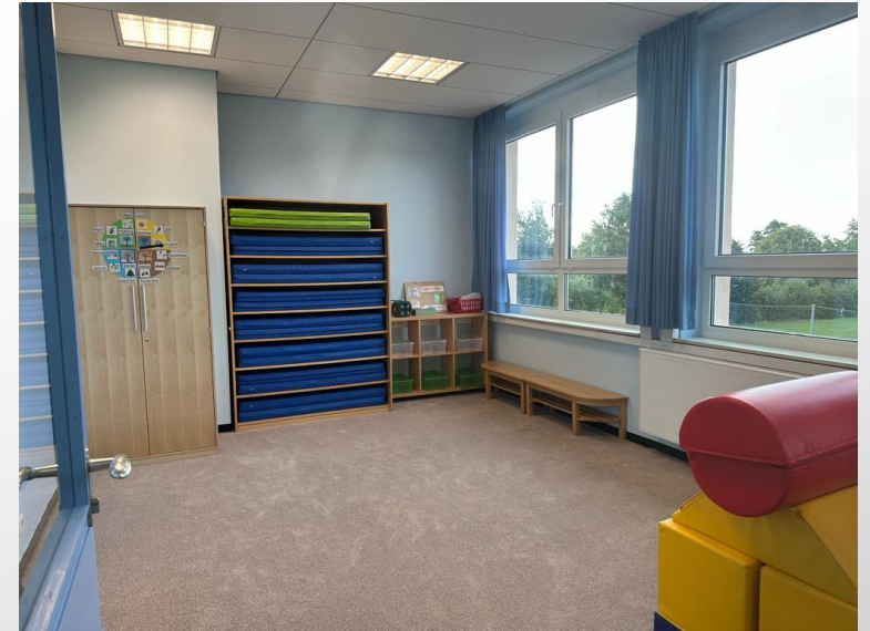
Gruppenraum mit angrenzendem Nebenraum