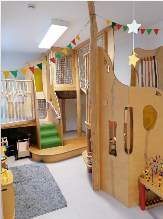
Klettereinbauten von Schilling