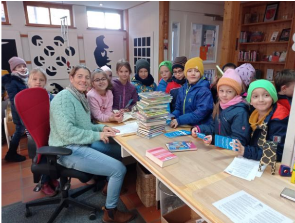
Schulklassenbesuch in der Bücherei