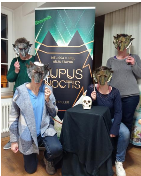
Autorenlesung im Pfarrheim