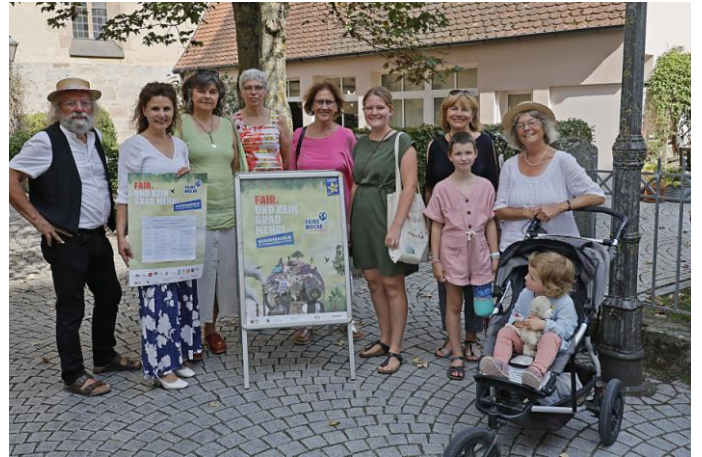
Auftaktveranstaltung „faire Woche“