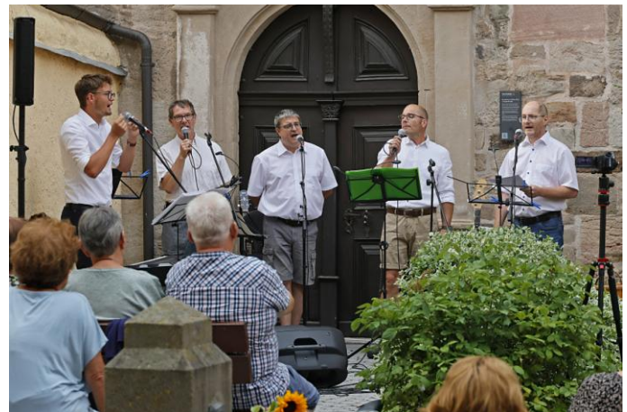
Sommerabend mit der Gruppe „Kellergeister“